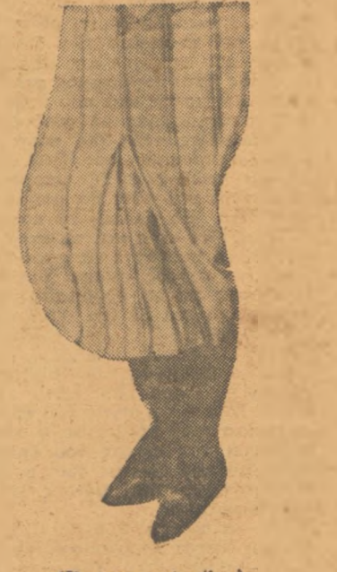
(Συνέχεια καὶ τέλος)

Τώρα τί μούτρα θὰ ἔκανε ὁ δεῦτερος κύριος ὅταν ἐμάθαινε ὅτι τὸ τραπέζακι ποὺ εἶχε καθῆσει ἦταν ὑποθηκωμένο με μίαν γρανίτσα, ἕνα καφέ, καὶ δύο λεμονάδες με λεμόνι, τὰ φαντάζεται κανεῖς... Κοναν-ντο.