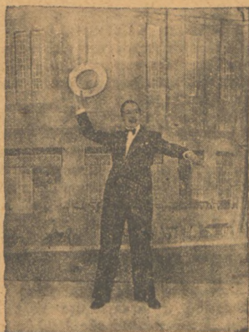
Παρακαλούνται οι έν Άθήνας και Πειραιεί άναγνώσταί τής «Παπαρούνας» να μάς πληροφορήσουν σε ποιό θέατρο ειδαν κομψότερον δανδήν από τον εικονιζόμενον και να μάς ειπούν ποιός εινε.