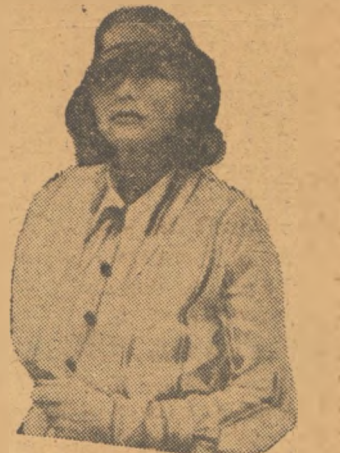
(Συνέχεια εἰς τὴν 7ην σελίδα)