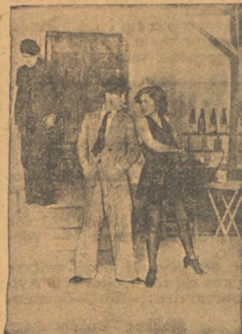
Τρομερά σκηναί διαδραματίζονται κάθε βραδυ είς ένα κέντρον διασκεδάσεως των Παρισίων. Η άνω εικονιζόμενη απάχισσα σκοτώνει τον άνθρακον που έσοκότωση τον έραστήν τής—και καταχειροκροτείται (θέατρον «Περροκέ»).