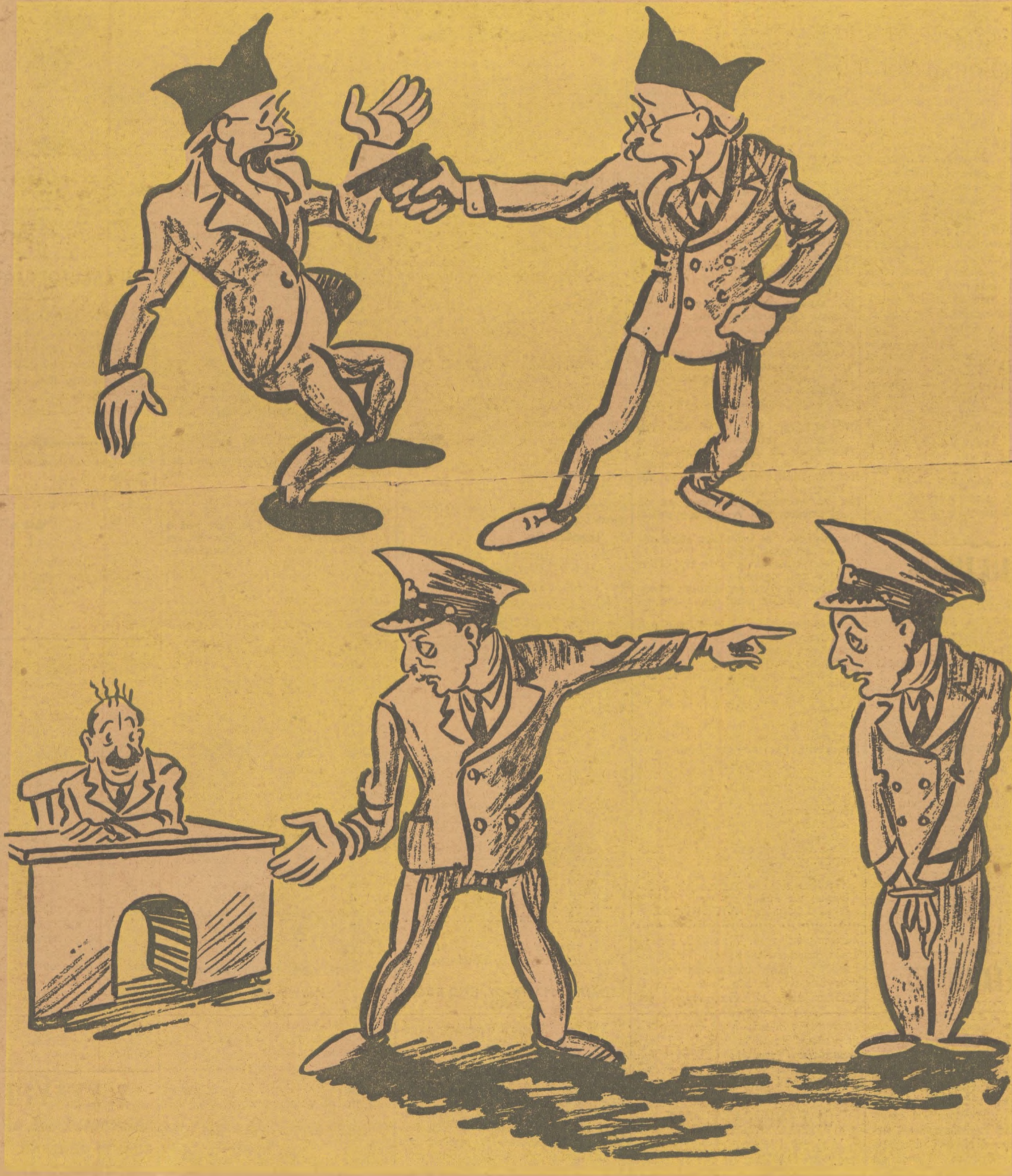
ΑΝΩ: Ποίος έπυροβόλησε τόν κ. Βενιζέλον. ΚΑΤΩ: Ποίος συνέλαβε τόν κ. Πολυχρονόπουλον.