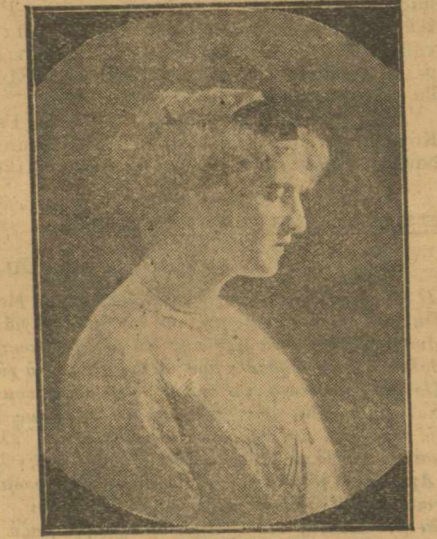
Άρ. 1. Μ. Σακ. εκ Λαμίας (Άποστολεύς Γ. Τ.)

Εικόνες από το δημοψήφισμα καλλωνών. (Όροι του δημοψηφίσματος εις το ύπ' αριθ. 36 φύλλον της «Σφαίρας»).