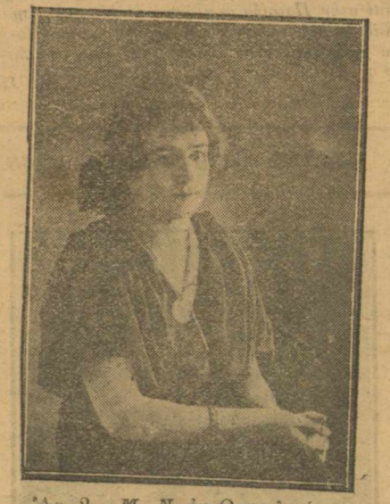
Άρ. 2. Μ. Ν. εκ Θεσσαλονίκης (Άποστολεύς Ν Σταμ.)

Ο γραμματευσής Πραγματενή, πραγματενή, φέρε τις πραγματίες σου Να βγούνε ναγγράσουνε της γειτονιάς οι κόρες, Να πάρουν άλλες την κλωστή και άλλες το κορδόνι Να πλέκουνε ότην πόρτα τους του δειλιου τις ώρες. Την ώρα που γυρίζοντας οι αγαπητικοί τους, Από τ' άμπέλι, θα τις δούν γεμάτες όλο χάρι, Και τις μικρές ξηλεύοντας και προκομένες κόρες Να πη καθένas: «Νά με ποιά,θα γίνωμε ζευγάρι». Άπ. Ν. Μαγγανάρης