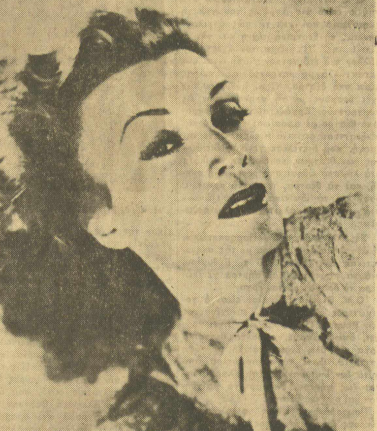
Η δημοφιλής Ισπανίδα καλλιτέχνη ΚΟΝΤΣΙΤΑ ΜΟΝΤΕΝΕΓΚΡΟ, σε τελευταία φωτογραφία της.