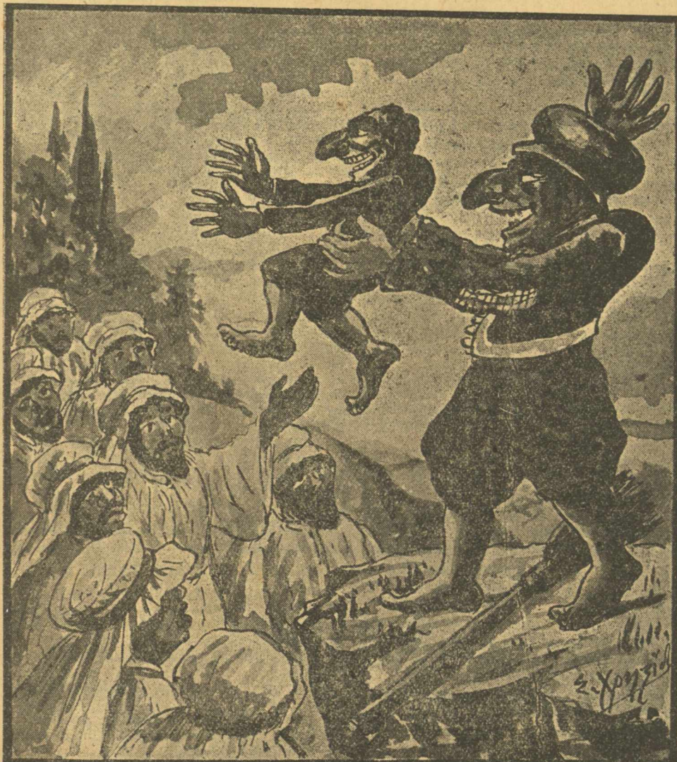
Ο ΒΑΣΙΛΕΥΣ ΚΑΡΑΓΚΙΟΖΗΣ ΠΑΡΟΥΣΙΑΖΕΙ ΕΙΣ ΤΟΝ ΛΑΟΝ ΤΗΣ ΒΕΡΟΥΤΗΣ ΤΟΝ ΔΙΑΔΟΧΟΝ ΤΟΥ Ο ΛΑΟΣ ΤΗΣ ΒΕΡΟΥΤΗΣ. — Ζήτω ο Διάδοχος! Τι θέλεις να σου χαρίσουμε; ΚΟΛΗΤΗΡΙ. — Πλεμόνια κι' άντελάκια.