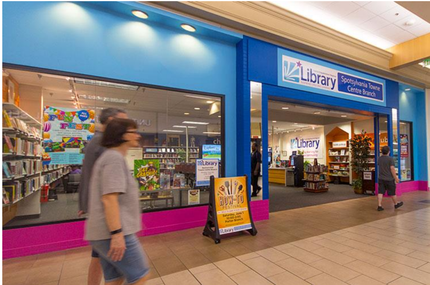
Spotsylvania Towne Centre branch, Central Rappahannock Regional Library, Fredericksburg, Virginia