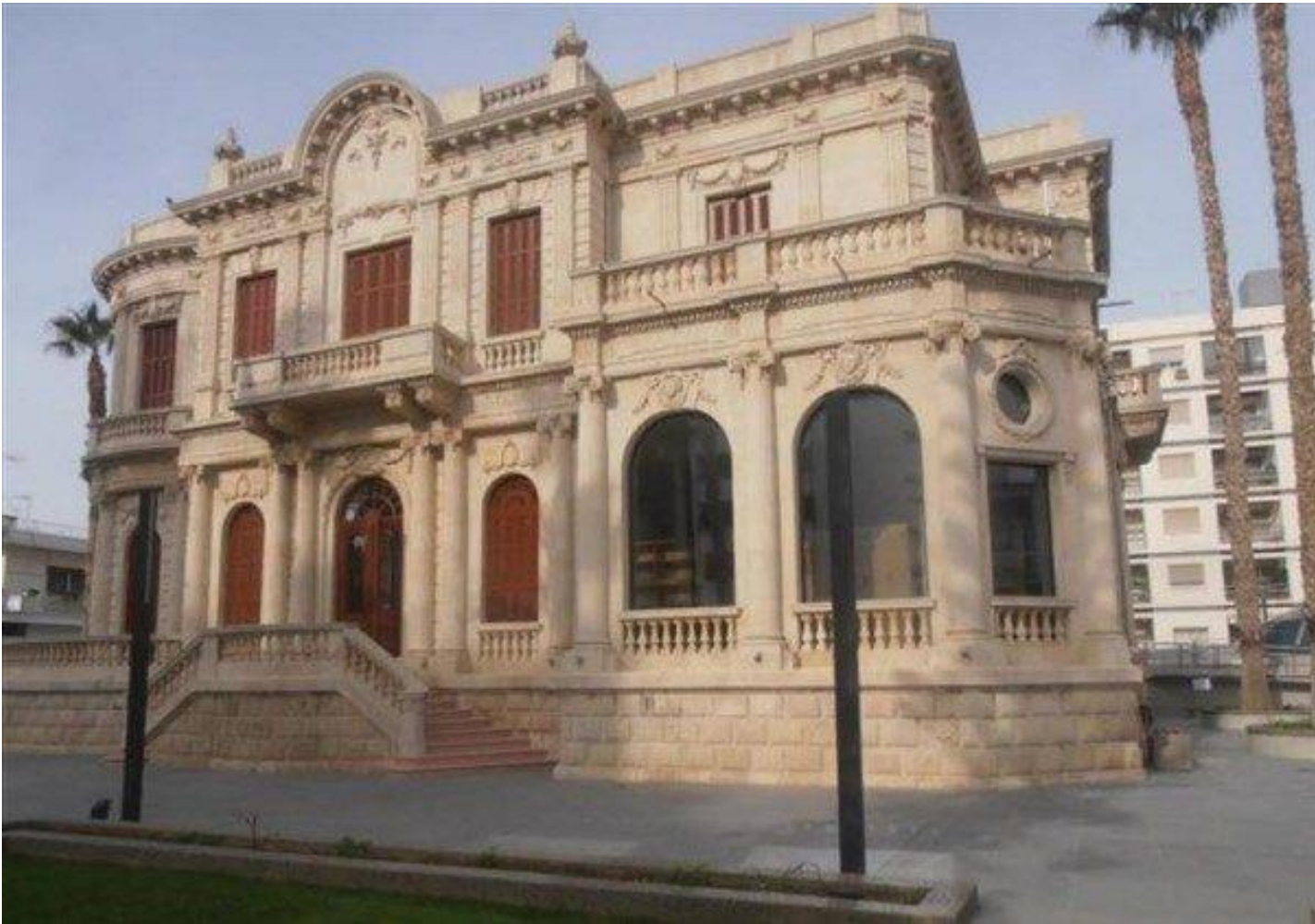
Δημοτική Βιβλιοθήκη Λεμεσού