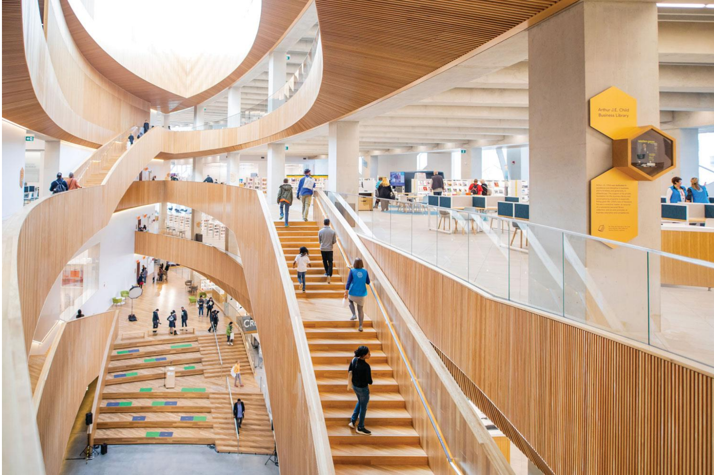
Calgary Central Library