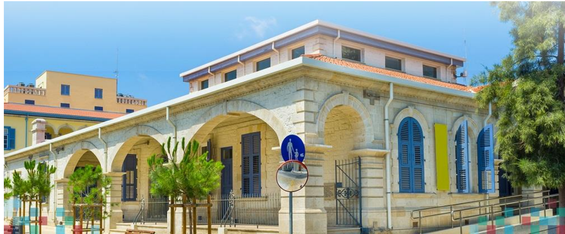
Βιβλιοθήκη «Βασίλης Μιχαηλίδης»