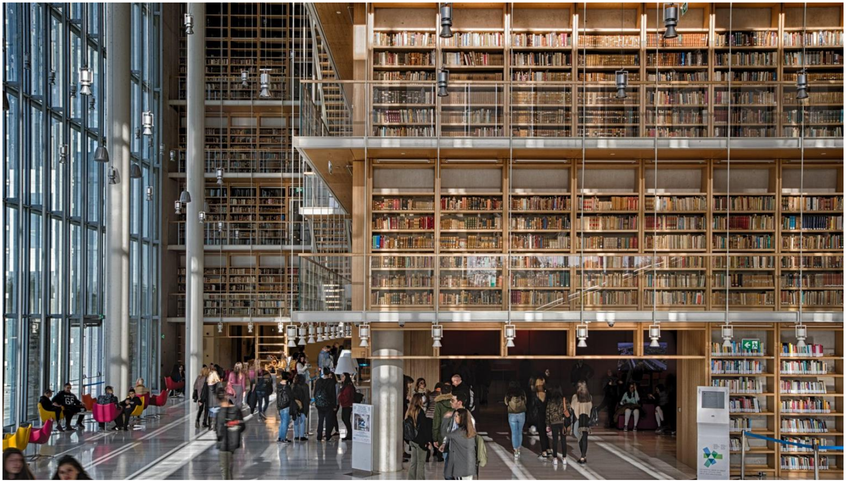
Εθνική Βιβλιοθήκη Ελλάδος