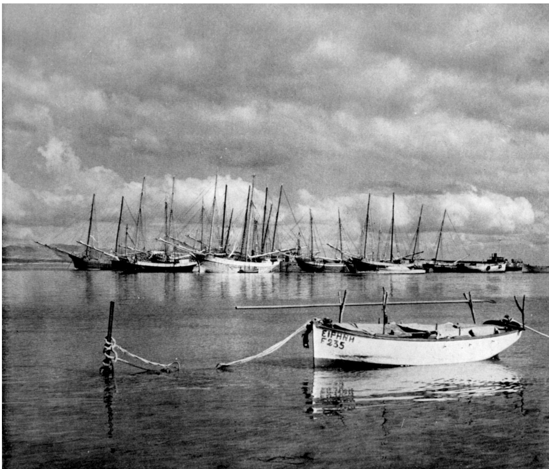
Το λιμάνι της Αμμοχώστου όπως το αποτύπωσε ο φωτογραφικός φακός του Reno Wideson· έχει τίτλο "Ειρήνη, Famagusta", και είναι από το βιβλίο του Cyprus in picture , 1953.