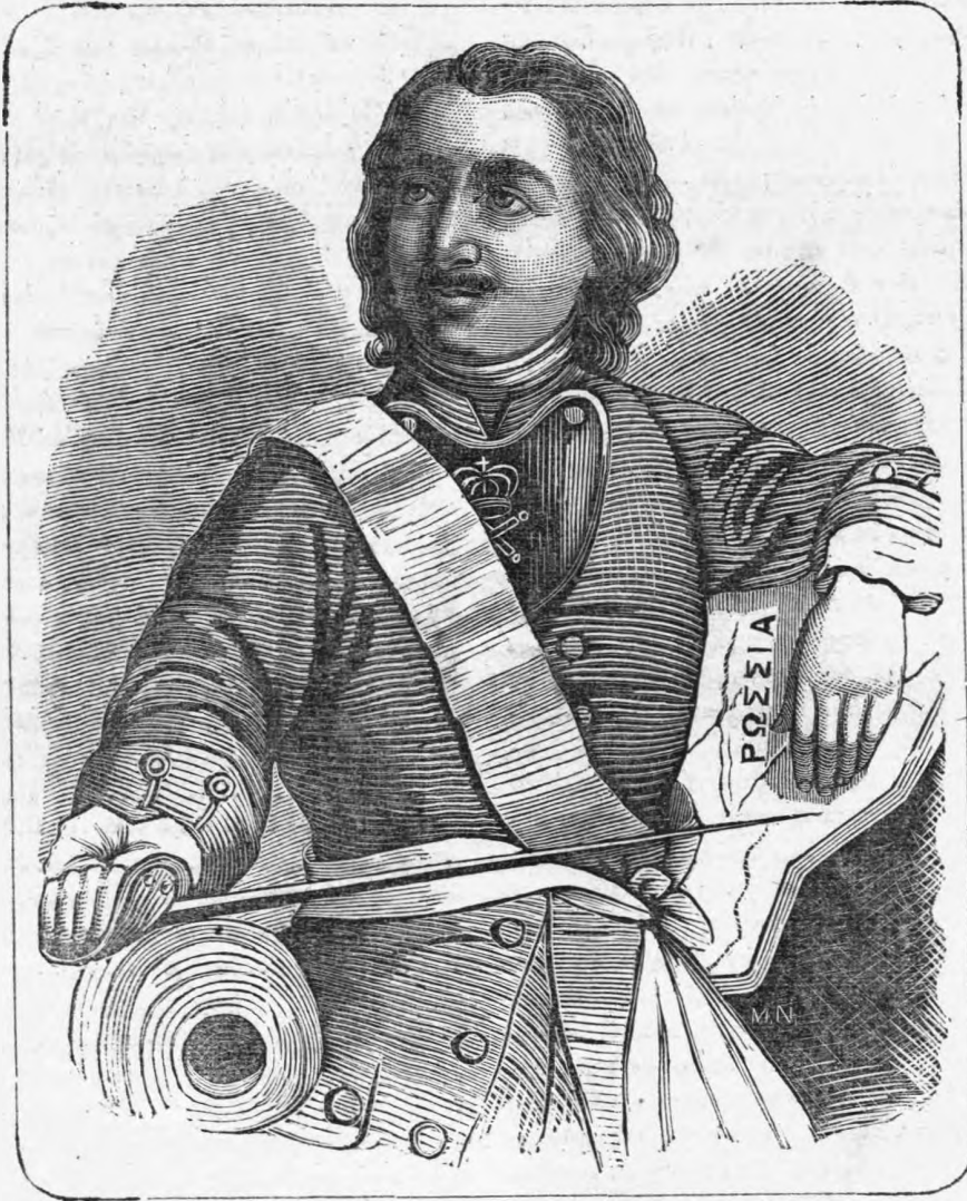
Ο ΜΕΓΑΣ ΠΕΤΡΟΣ.

κατὰ τοῦ Πέτρου καὶ καθ' ὅλων τῶν Νηρισκίων καὶ τότε συνέβη ἐν Μόσχῃ τρομερὰ στάσις, ἐξ ἧς τὴν 15 Μαΐου τοῦ ἔτους 1682 ἐγύθη πολὺ αἰμάτων, ὥστε ἐπὶ τέλους ἀπεφασίσθη νὰ ἀναβῶσιν ἐπὶ τοῦ θρόνου καὶ οἱ δύο βασιλόπαιδες. Ἡ στέψις δὲ αὐτῶν ἐξετελέσθη τὴν 23 Ἰουνίου καὶ ἡ Σοφία ἐκμύχθη κυβερνήτρια τοῦ βασιλείου.