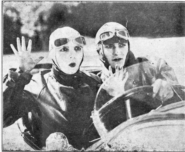
Η Φράνς Ντελιά και ο Ροζέ Τρεβίλ εις μίαν ώραϊαν σκηνήν της «Έξαδέλφης από την Γαλλίαν»

Διασθάνομαι πόσην ευχαρίστησιν οι αναγνώσται θα πληροφορηθούν ότι η Φράνς Ντελιά, εντυχώς διά την ιδίαν, και διά τους πολυπληθείς θαυμαστάς της, αλλά πρό παντός διά την Έβδομήν Τέχνην, εξακολουθεί ευρισκομένη εν τη ζωή χωρίς να έχη κατά νουν να την εγκαταλείψη. Τό επιβεβαιού η κατωτέρω λακωνική και ώραία εις ύφος επιστολή της δι' ης απαντά εις σχετικήν ερώτησιν μου ζητούσαν τας εντυπώσεις της από την σύγκρισιν ήν προκάλεσεν η όμοιότης τού όνόματός της με της προχθεσινής αυτόχειρος εις τους κύκλους τών Έλληνων θαυμαστών της.