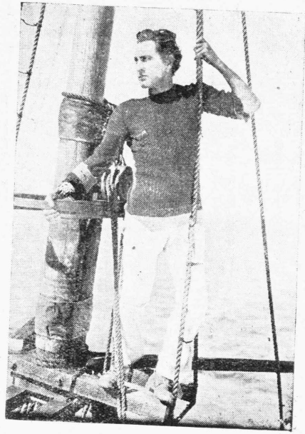
Ο Τζόν Μπαρρμπορ εις μίαν σκηνήν του έργου «Τίγρις των θαλασσών» πουν θα παρουσιάσθι λίαν προερχώς ή «Σινέ Όριάν».