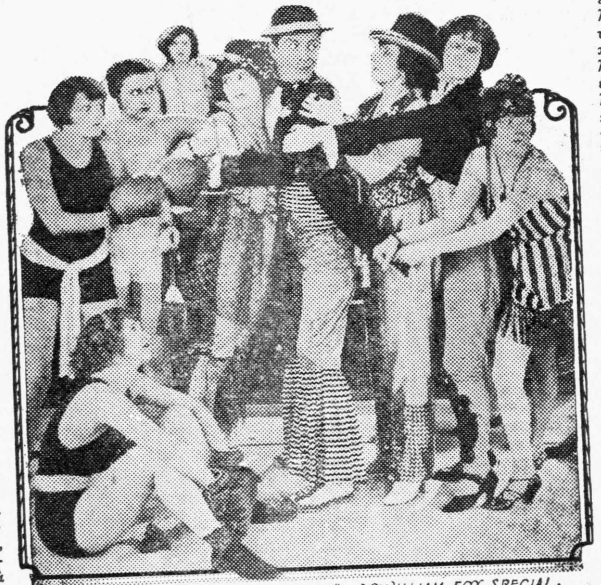
SCENE FROM "THE LAST MAN ON EARTH" A WILLIAM FOX SPECIAL

όποια κυτοῦσε γιά σένα. Είναι καιρός να μάθης ότι πρέπει να παντρευτώ; του επαντή εκείνη. Μά κ' αν άκούη ένας άντρας; έμεινε στη ήγ πάλι δεν θα τόκαμα αυτό.