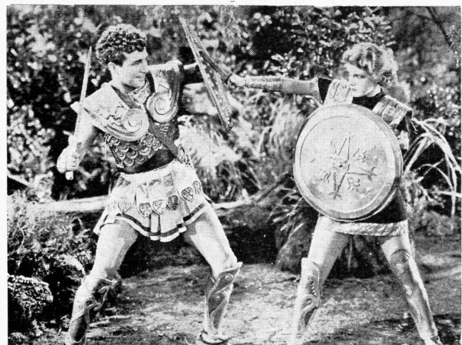
Μία χαρακτηριστικῆ σκηνῆ του ἀρχαίασ Ἑλληνικῆσ ὑποθέσεωσ ἔργου The Warrior's Husband «Ἀμαζόνιοι Ἐρωτεσ» (προσωφρονὸσ τίτλοσ) παραγωγῆσ Φὸσ Φιλμ, 1933—34, με τοῦσ Ἑλιζα Λάντου καὶ Μάρτζορϋ Ραμπῶ.

ΠΩΛΕΙΤΑΙ ΤΗΛΕΦΩΝΟΝ συστήματοσ Ὀύεστερον Ἑλέκτρικ χειροκίνητον ἐφοδιασμένον καὶ με δύο ξεροὸσ στήλασ ἀπαντα καινοουργῆ, καταλλήλοταον δι' Ἑπαρχίαν, εἰσ πολὺν συμφέρουσαν τιμήν. Πληροφορία εἰσ τὰ γραφεῖα του «Κινηματογρ. Ἀστῆροσ».