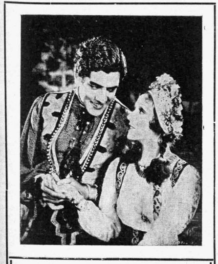
Μία όραία σκηνή από το τελευταίον έργον του γνωστού μας Ζοζέ Μογκίκα ‘Ο ‘Αρχαίολογανος’ (King of Gypsies) παραγωγής ΦΟΞ-ΦΙΛΜ 1933—34 εις ό λαμβάνει μέρος και άρωσιστάτη Ροζίτα Μορένο

—‘Ο περίορμος Χατζόπουλος της Πρεβέζης απέκτισεν επί τέλους ύπολογισμον συναγωνιστήν. Ένας άλλος κινηματογράφος καθ’ όλα εύταρουσιαστος και σεβόμενος την διανοητικήν άξίαν τών φίλων του κινηματογράφου της Πρεβέζης, κάνει χρυσές δουλειές με της έκλεκτές ταινίες που προβάλει, ένφ άντιθέτως ό Χατζόπουλος, ξεακολουθεί να δέχεται τούς γαργιάδες του λιμανιού και πολλές φορές να χορηγεί εισιτήρια εισπράτων το άντίτιμον αυτών εις έδρος άντι ροχημάτων (αυγά κλπ.).