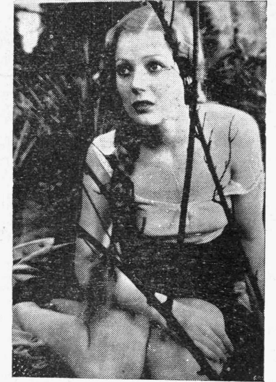
Ἡ Λωρέττα Γιώγκ στὴ νέα ταινία παραγωγῆς Φόξ φιλμ «Ἐνα δράμα στὸ θηριοτροφεῖον» (Zoo in Budapest).

Τὸ ἡμερολόγιον αὐτὸ, ἐδημοσιεύσεως, ὡς γὼ ἐτόμενον, πανδαμῶν διαμαρτυριῶν στὸ Χόλλυγουντ.