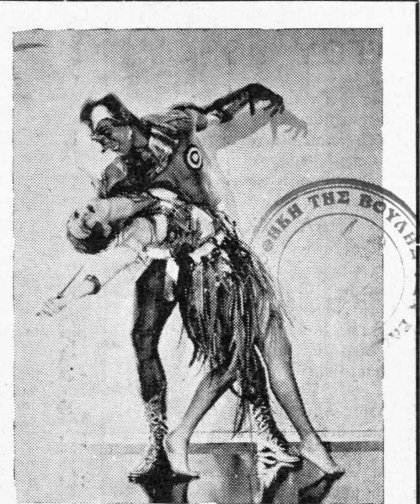
Μία εικόν της σκηνής του χορού των παρθένων από την νέαν ταινίαν I loved you Wednesday «Την Τετάρτην σ' έρωτεύθηκα», παραγωγής Φόξ Φιλμ, με την περιφημη Έλζις Λάντι.