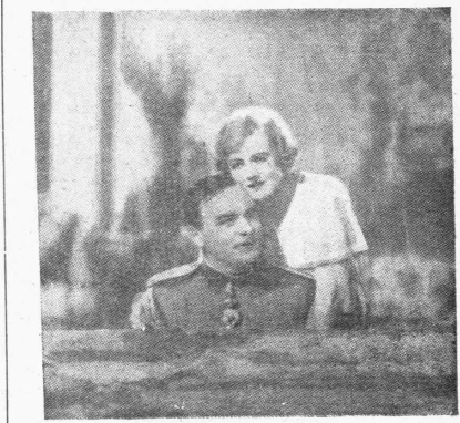
Είς τήν άνωτέρω εικόνα δημοσιεύθησαν και είς τό προηγουμέν—ον τεύχος εκ παραδρομής έπείθ κίτθεν αττής ή έπι—χρηστώδης με τήν Άδελφ Κίρον ένφ φρονίαια περι—σπής εκ του έγνου «Η μεγάλη δούκισσα Άλεξάνδρα» με προταγονήσιον τήν περίφημη βενεζιά σσοφάν Μαρία Γερίτζα και τον Πάουλ Χάτμαν. (Έκμ.σ. Μαργουλή).