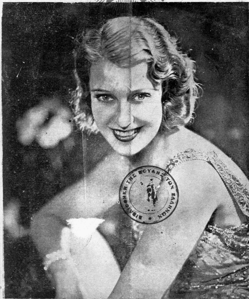
ZANET MAK NTONALT

Ἡ περὶ χαριτωμένη ἀμερικανὶς καλλιτέχνης τοῦ κινηματογράφου ἦτις προσελήφθη ὑπὸ τῆς «Μέτρο—Γιόλντου—Μάγερ». Ἦδη πρωταγωνισαί μετὰ τοῦ Ρ. Νοβάρρο εἰς τὸ νέον φιλμ «Ἡ γάτα καὶ τὸ βιολί», θὰ ὑποδυθῇ θὲ καὶ τὸν ρόλον τῆς Εὐθύμου Χήρας εἰς τὴν ὁμώνυμον γνωστὴν ὀπερέτταν εἰς τὴν ὁποίαν, τὸν πρωτεύοντα ἀνδρῖνον ρόλον θὰ κρατῇ ὁ γάλλος Μ. Σεβαλιέ. Ἀμφότερα τὰ ἔργα εἶναι παραγωγῆς Μ.Θ.Μ.