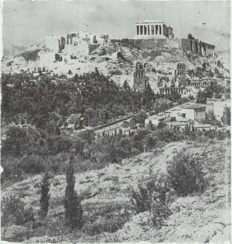
Ἡ Ἀκρόπολις τῶν Ἀθηνῶν μετὰ τῶν πέριξ. Κάτω τὰ εἰλίπια τοῦ ρωμαϊκοῦ Ὁδείου Ἡρώδου τοῦ Ἀττικοῦ.