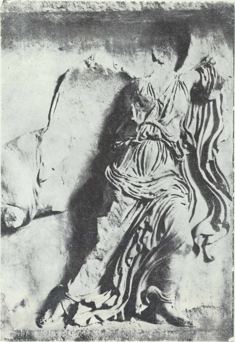
Ἀνάγλυφον Νίκης ἐκ τοῦ περὶ τὸν ναὸν τῆς Ἀθηναῖς Νίκης θωρακείου.