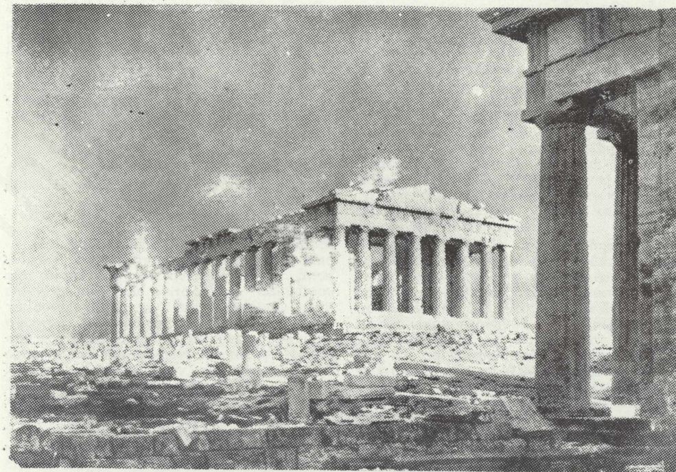
Ὁ Παρθενῶν, ὡς ἔχει ἀναστηλωθῆ μετὰ τῆς βορειοανατολικῆς γωνίας τῶν Προσυλαίων.

Ἔτσι μᾶς ἐσώθησαν τὰ ὠραῖα αὐτὰ ἔργα τῆς ὑστερας ἀρχαϊκῆς ἐποχῆς. Τὴν ἰδίαν τύχην ὅμως δὲν εἶχον τὰ ἄλλα μνημεῖα τῆς πόλεως, ὅπως τὸ Ἐκατόμπεδον τοῦ Πεισιστράτου, περὶ τοῦ ὁποῖου ὠμιλήσαμεν, καὶ ὁ πρῶτος Παρθενῶν, τὸν ὁποῖον οἱ καθησυχάσαντες ἐκ τῶν ἐσωτερικῶν ἐρίδων διὰ τῆς ἰδρύσεως ὑπὸ τοῦ Κλεισθέους τῆς ἀθηναϊκῆς δημοκρατίας Ἀθηναῖοι εἶχον ἀρχίσει νὰ ἰδρῶουν, ἀπὸ τοῦ τέλους τοῦ 5. αἰ. π. Χ., πώρινον κατὰ πρῶτον, εἶτα δὲ μαρμάρινον, ἀλλὰ μικρότερον, μεγαλύτερον ὅμως τοῦ Ἐκατομπέδου, πρὸς τιμὴν τῆς μεγάλης προστάτιδος. Εἰς ὅλα αὐτὰ ἐξέσπασεν ἡ θαρβαρικὴ ὀρμή, ὅταν ἀκάθεκτος τῷ 480 π. Χ. κατῆλθεν εἰς τὴν Ἀττικὴν καὶ εἶδρε τὴν ἱκανοποίησίν τῆς εἰς τὴν βεθῆλωσιν παντὸς ἱεροῦ, τὸ ὁποῖον ἐνεκλείετο εἰς τὰ τείχη τὰ τεχνητὰ καὶ τοὺς φυσικοὺς βράχους τῆς Ἀκροπόλεως. Ἀλλ' ἡ ἐχθρικὴ λαίλαψ παρῆλθε ταχέως καὶ ἀνεπιστρεπτί. Βαρεῖα ἔπεσεν ἐπ' αὐ-