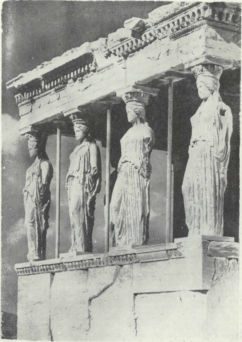
Αἱ Καρνάτιδες τοῦ Ἐρεχθείου.