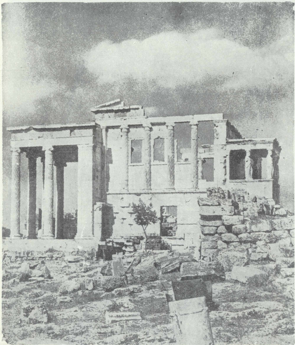
Τὸ Ἐρέχθειον μετὰ τῆς προστάσεως τῶν Καρυατίδων δεξιὰ καὶ τοῦ ἱεροῦ χώρου τοῦ Ποσειδῶνος ἀριστερά.