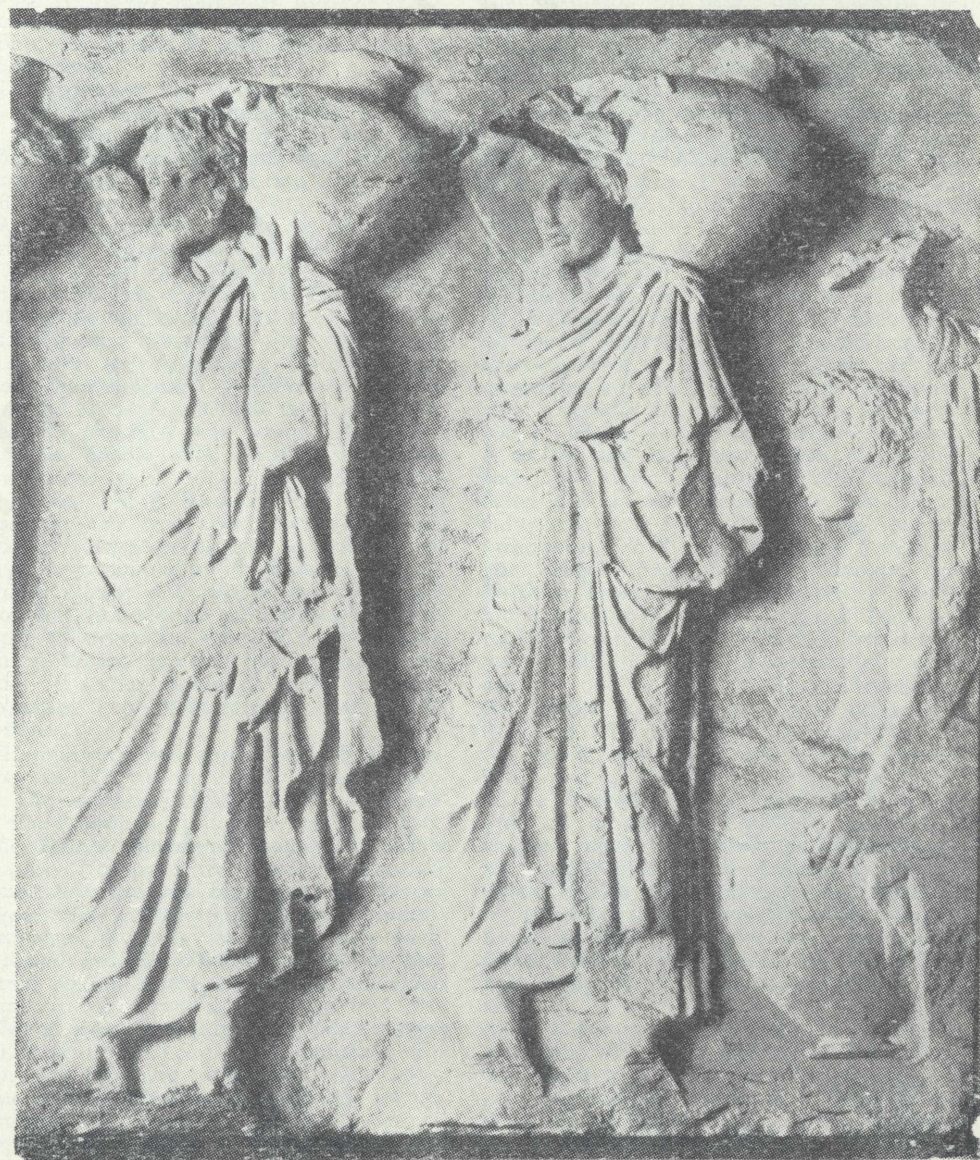
Ἐπιτύμβιοι ἐκ τῆς ζωφόρου τοῦ Παρθενῶνος.

Ἡ Ἀκρόπολις διὰ τὸν Περικλέα ἐσυμβόλιζεν ἅπαν τὸ πνεῦμα ποὺ κατεῖχε τοὺς Ἀθηναίους, ἦτο τὸ πνεῦμα ποὺ ἐνέβαλλεν εἰς αὐτοὺς ἡ πολιοῦχος θεὰ, ὅπως τὸ εἶδομεν νὰ ἀναπτύσσεται εἰς τὴν ἑλληνικὴν θρησκείαν κατὰ τὴν μακρὰν περίοδον τῆς ἐξελίξεώς της. Ἐκεῖ ἐπάνω λοιπὸν ἔπρεπε νὰ στηθῇ ὁ ναὸς τοῦ πνεύματος ἐκείνου, διὰ νὰ ἀκτινοβολῇ ἀπὸ ἐκεῖ τὴν ἀνταύγειαν τῆς δυνάμεώς του καὶ νὰ φωτίζη ὅλον τὸν γύρω του ἑλληνικὸν κόσμον, μὲ τὸ φῶς τῆς σοφίας καὶ τῆς ἀρετῆς συνδυασμένης μὲ τὴν σώφρονα πολεμικὴν ροπήν, ἡ ὁποία ἐχαρακτήριζε τὴν θεάν. Καὶ ὁ ναὸς ἐστήθη! Ἦτο ὁ Παρθενῶν! Ἐννέα χρόνια ἐχρειάσθησαν ἀπὸ τοῦ 447 μέχρι τοῦ 438 π. Χ., διὰ νὰ γίνη τὸ κύριον οἰκοδόμημα μὲ τὸ ἄγαλμα, ὡστε νὰ ἐορτασθοῦν τὰ ἐγκαίνια αὐτοῦ, καὶ ἄλλα ἔξ χρόνια ἀκόμη, μέχρις ὅτου τὸ ὅλον ἔργον συμπληρωθῇ. Ὁ Περικλῆς ἦτο ὁ δημιουργὸς νοῦς τοῦ ὅλου ἔργου, ὁ Φειδίας ὁ μέγας καλλιτέχνης καὶ ἐπόπτης αὐτοῦ, ὁ Ἴκτινος ὁ ἀρχιτέκτων τοῦ ναοῦ, ὁ Καλλικράτης ὁ ἐργοδηγὸς καὶ σωρεῖα ἄλλων ἀγνώστων κατὰ τὸ πλεῖστον καλλιτεχνῶν