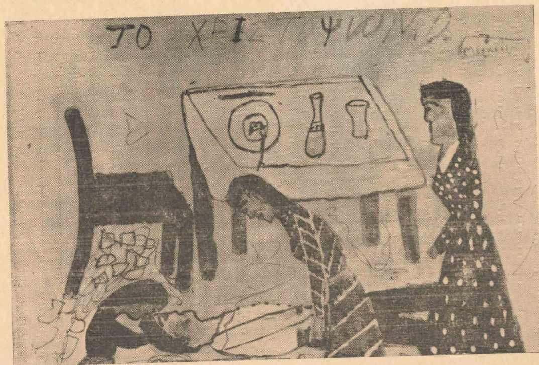
Έργο του ΝΙΚΟΥ ΜΕΡΚΟΥΡΗ (Β' α)