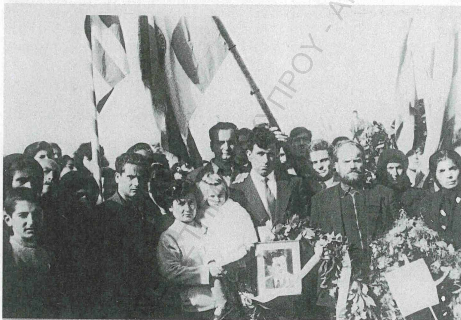
Οι γονείς του ήρωα και άλλοι συγγενείς του μαζί με την ιδιοκτήτρια της οικίας όπου έπεσε ο Μάτσης, τη μέρα των αποκαλυπτηρίων της προτομής του ήρωα.

επανελήφθη, γεμάτων υπερηφάνειαν και πίστιν το προγονικόν «μολών λαβέ». Και ο Κυριάκος Μάτσης εισήλθε διά της θυσίας του εις το Πάνθεον των μεγάλων μορφών της ελευθερίας. Πόση ευγένεια, πόση πίστις, πόση αρετή επεσφράγισε την θυσίαν του ήρωος. Από τον ιστορικόν τούτον χώρον εξεπήγασεν η ιερά επιταγή του χρέους και του καθήκοντος και ο άνεμος της ελευθερίας έπνευσεν απ' άκρου εις άκρον της νήσου, διά να άρη το μίasma της δουλείας και να σαρώση τα σκοτεινά σύννεφα της αποικιοκρατίας από τον γαλανόν ουρανόν μας. Εδώ επεσφραγίσθη διά της θυσίας του Κυριάκου Μάτση η πράξις της ανεξαρτησίας της πατρίδος μας. Από το κρησφύγετόν του εφύτρωσε καλλίκορμον και καλλίκλαδον το δένδρον της κυπριακής ελευθερίας.