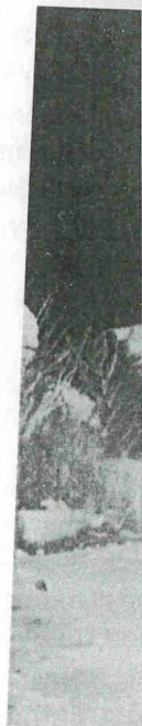
Ο αδελφός του ήρωα τη