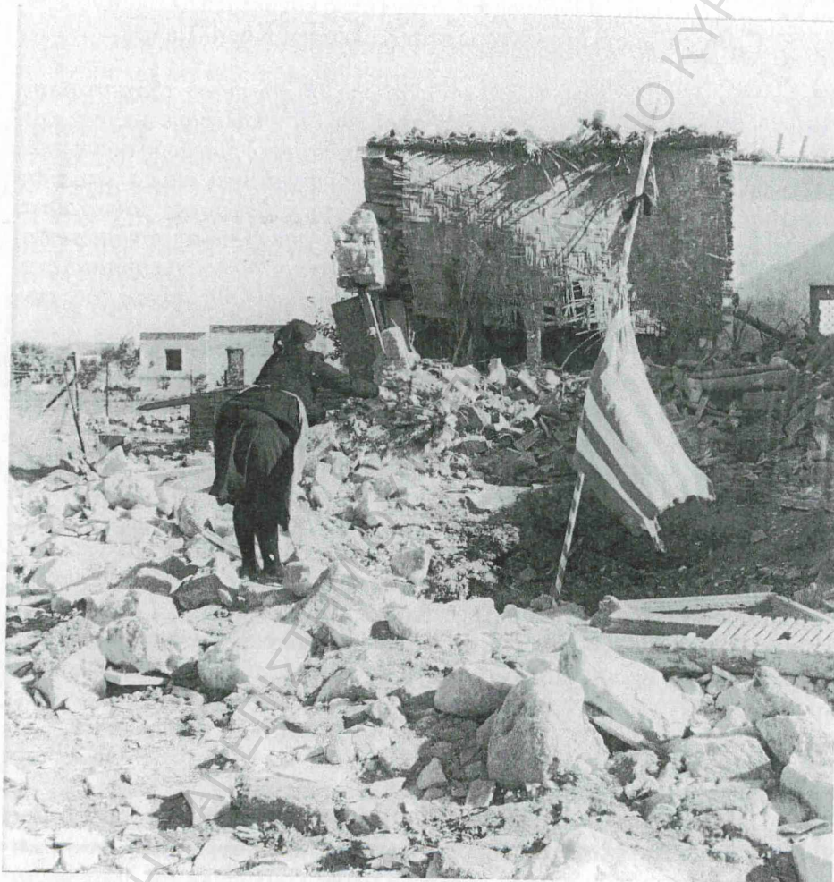
Ο τόπος της θυσία του ήρωα με τη γαλανόλευκη να κυματίζει...

...Νοέμβριος του 1958. Ο απελευθερωτικός μας αγώνας βρίσκεται στο αποκορύφωμά του. Τα ανδρεία παλληκάρια του Διγενή καταφέρουν σκληρά κτυπήματα εναντίον των Βρετανών. Στο Δίκωμο μέσα σ' ένα απόμερο σπίτι