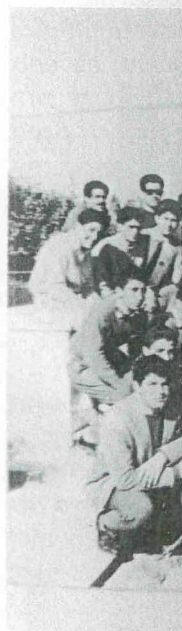
Μαθητές τ καθηγητές τ

Την ίδια μέρα τ τα Α' «Μάτσει θέση σε σύνολο