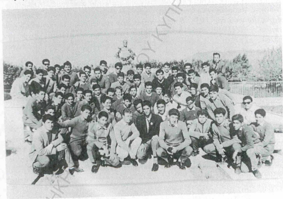
Μαθητές του Λυκείου Νεοκλέους, ανάμεσά τους και Δικωμίτες, μαζί με καθηγητές τους αποτίουν φόρο τιμής στο σταυραετό του Πενταδακτύλου.

Την ίδια μέρα το απόγευμα τελέστηκαν στην Κερύνεια στο Γ. Σ. Πράξανδρος τα Α' «Μάτσεια» με συμμετοχή αρκετών αθλητών. Το Δίκωμο πήρε την έκτη θέση σε σύνολο εννέα συμμετοχών. Διακρίθηκαν οι αθλητές του: