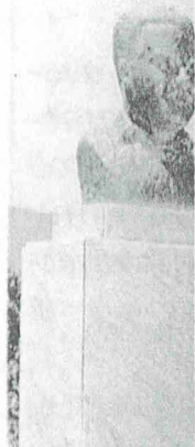
Κυρηνείας, Λ Καζαφανίου, Α