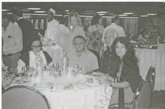
Στην τραπεζαρία του καραβιού