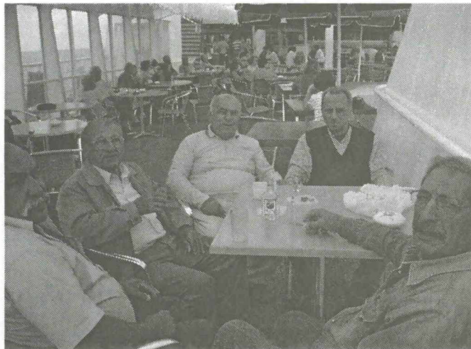
Στιγμιότυπο στο κατάστρωμα του καραβιού

Περάσαμε πολύ όμορφα, χαρήκαμε ωραίους τόπους, διασκεδάσαμε και γενικά επιστρέψαμε πολύ ευχαριστημένοι.