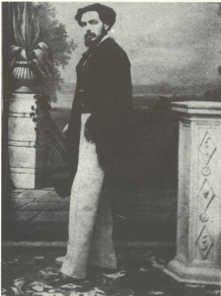
Ο Εμμανουήλ Ροΐδης, φωτογραφία του Π. Μωραΐτη.