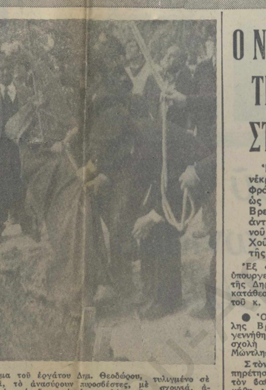
Τδ πνισμα τού έργασιού Διπ. Θεωδότου, τολμμένο σέ μνημείο τδ άνθιστων ποσειδέως με σφραγιή δέ τόν άναγώ, όπου τδ είχαν κληθείς έργοι, χωμάτων.

Σήμερα φεύγει τδ «Βοτέγκο» για τήν Μάλτα προς έπισκέψη και άναχωρεί στην Αθήνα από εκεί στή «Πήρος» για διακοπές δ αντιπρόεδρος τής «Ορεινάν» κ. Ήνικέρι. Θα έπιστρέψη άργότερα στην Αθήνα και θα έχη συζητήσει με τήν ελληνική κυβέρνηση επί τού θέματος τής εκμεταλλεύσεως τού πετρελαίου τής Θάσου.