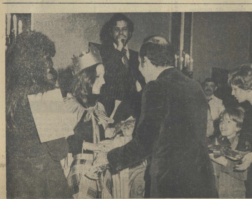
Ένα ώραίο στιγμιότυπο από τόν προχθεσινό χορό που ώρ...