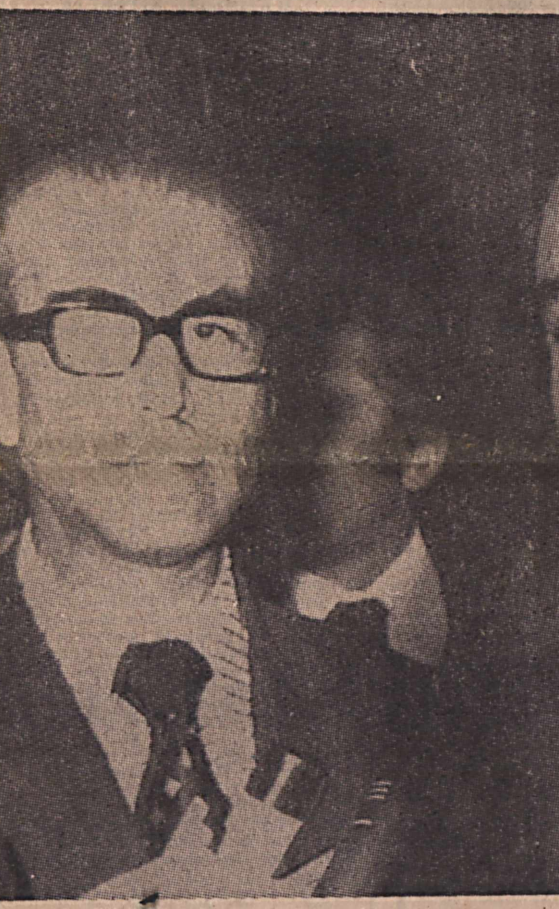
Ο Έτσεβιτ άναγγέλλει από τήν τηλεόραση τήν έναρξη της εισβολής των τουρκικών στρατευμάτων στην Κύπρο. Προηγουμένως είχε θέσει τάσκαες όρους στην Άγγλία.