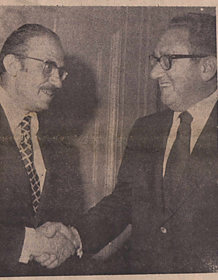
Ο Κλαϊνγκερ με τόν Τούρκο συνάδελφό του Γιουνέξ σε μία συνάντησή τους στην Ουάσινγκτον. Ο «μάγος» γνώριζε, τουλάχιστον, για τήν τουρκική εισβολή...