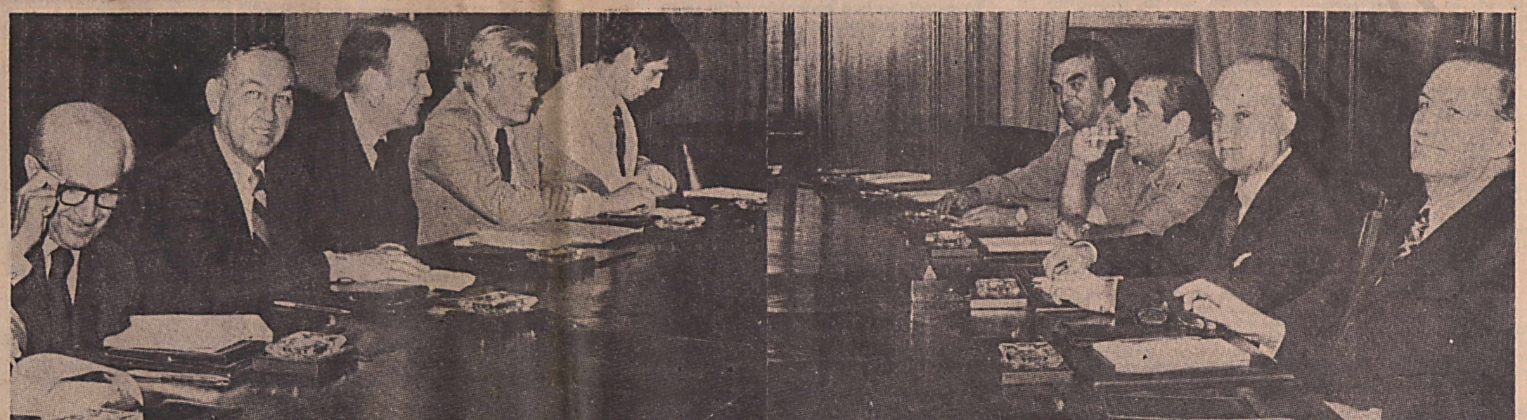
Στημιμόντο από την δραματική σύσκεψη για τό Κυπριακό, που πραγματοποιήθηκε στα Παλάια Άγκυρας, μεταξύ του Άμερικανού άμνηστοργού Έξωτερικών Τζόζεφ Σίσκο και του πρώτου Λένου Τάσκα και της κυβερνητικής Άδαμ Άρθουσοπούλου.