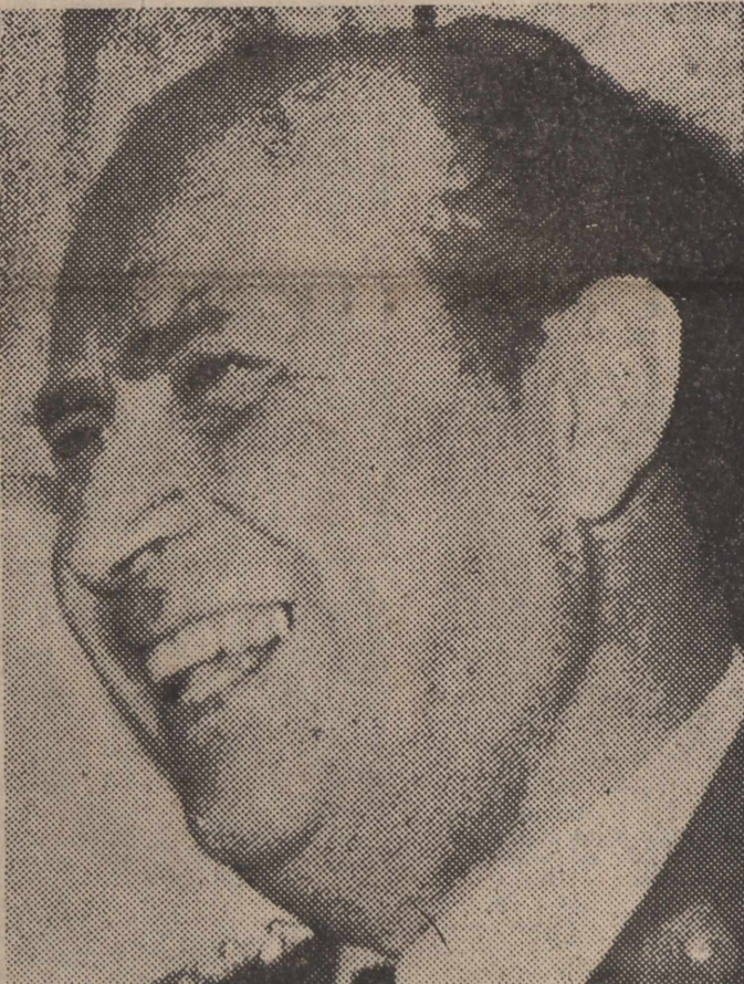
Ο Δ. Ἰωαννίδης. Οι συνομιλίες τοῦ Σεπτεμβρίου ἐκινεῖτο ἀπὸ αὐτό. Ἀλλὰ και κατ' ἐντολήν του;

ΑΥΡΙΟ: Γιατί δὲν ἐπρόδωσα τὸν Κ. Καραμανλῆ • Ἡ 21η Ἀπριλίου και ἡ 25η Νοεμβρίου • Πικρίες και ἀπειλές ἀπὸ παλιούς φίλους • Ήταν ὄντως ἰσχυρός ὁ «πανίσχυρος» Δ. Ἰωαννίδης;