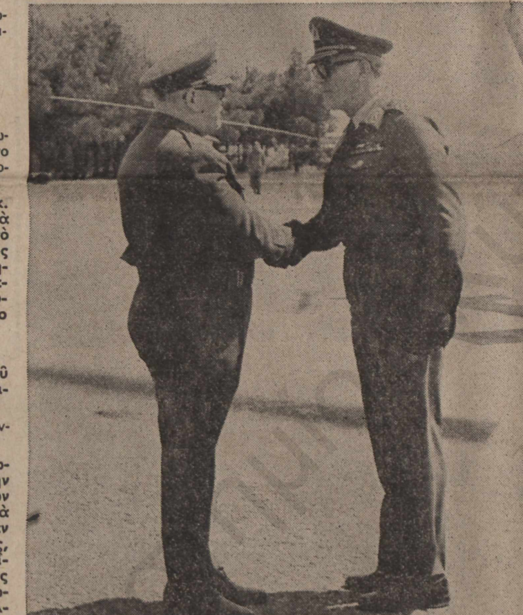
Ο στρατηγός Γκιζίκης με τὸν ἀρχηγὸ Στρατοῦ ἀντιστρατήγου Ντάβο.