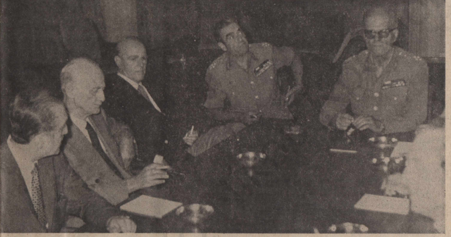
Όρα 3 και 10' της 23ης προς 24ην 'Ιουλίου 1974. Ο κ. Κ. Καραμανλής έχει φθάσει, προερχόμενος από τό Παρίσι, πριν 5 λεπτά. Πρώτη «κουβέντα» με τούς άρχηγούς τών 'Ενόπλων Δυνάμεων και τούς πολιτικούς. Με τόν στρατηγό Γκιζίκη τά έχουν ήδη «πει», πέντελεπτά πριν

Τελεσίγραφο Γκιζίκη προς Τάσκα. Η καταμάτη τού Τούρκου εντός δύο ωρών ή άναγγέλλομε την άποχώρησή μας από τό Ν.Α. Τ.Ο. — «'Ισως επανερχόμενος κ. πρόεδρο, θρεθείτε πρό κυβερνήσεως λοχαγών» — Ο κ. Καραμανλής είναι μακριά και δέν άντιμετωπίζεται περίπτωσι πρωθυπουργίας του — 'Η κρίσιμη διακοπή της συσκέψεως.