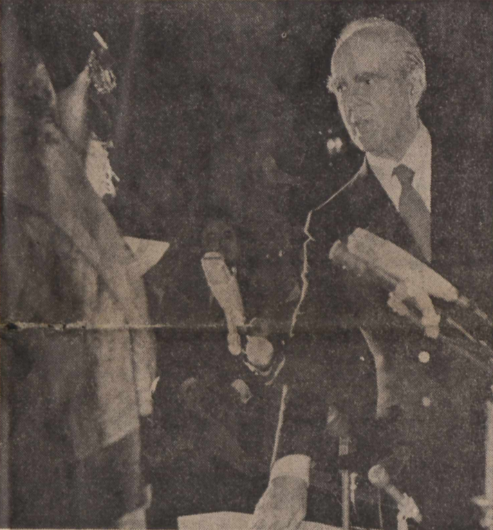
Όρα 4 και 15' της 23ης προς 24ην 'Ιουλίου. Ο κ. Κ. Καραμανλής όρίζεται.