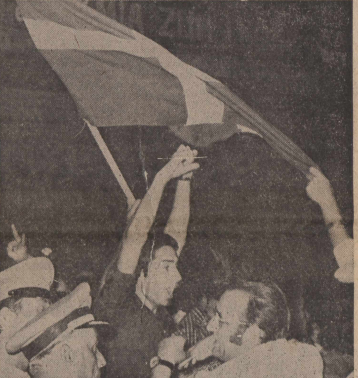
Όρα 8η έσπερηή της 23ης 'Ιουλίου 1974. Ο λαός έχει ξεχυθεί στους δρόμους τών 'Αθηνών. 'Ο έφιπλος πέλασ

ΤΗ ΔΕΥΤΕΡΑ: Τέσσερις φορές, μετά την μεταπολίτευση, κινδύνευσε ή Δημοκρατία και ό κ. Καραμανλής προσωπικά • Σχεδιάζεται ή σύλληψη τού Πρωθυπουργού μέσα στο γραφείο τού Προέδρου της Δημοκρατίας • Ποιός ήταν ό ένας από τούς όκτ(π) πολιτικούς που προσάβησε νά άφαιρέσει την πρωθυπουργία από τόν κ. Καραμανλή • Δραματική έκκλησι Γκιζίκη προς 'Ιωαννίδη: «Τάκην, για όνομα τού Θεού, ή Πατρίδα καταστρέφεται» • Τό τέλος της συνομιλίας τού στρατηγού Γκιζίκη με τόν Γιάννη Μαρῦ.