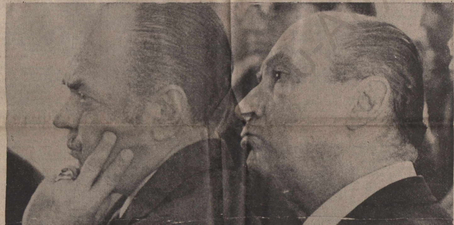
Ο Γ. Παπαδόπουλος με τόν Δ. Ίωαννίδη. "Ο κ. Παπαδόπουλος τόν έροθέτο και στις μέρες άκόμη που ύποτίθεται ότι ο πρώτος ήτο παντοδύναμος", λέει ο στρατηγός Γκίζικης.