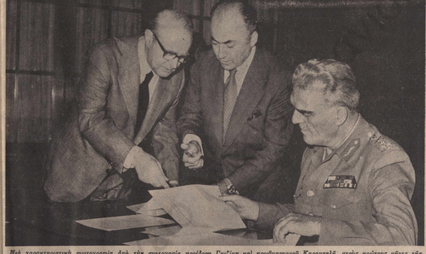
Μία χαρακτηριστική φωτογραφία από τήν συνεργασία προέδρου Γκίζικη και πρωθυπουργού Καραμανλή, στους πρώτους μήνες της μεταπολιτεύσεως, όταν οι συνομιλιές συνεχίζοντο και οι κίνδυνοι για τήν Δημοκρατία εξακολουθούσαν να ύπάρχουν

Η πρωτοβουλία των 4 στρατιωτικών άρχηγών — Οι στρατηγοί φοβούνται μήπως συλληφθούν από τόν Πρόεδρο — "Ο Ίωαννίδης είχε τή δύναμη να ματαιώσιν τήν άλλαγή της 23ης 'Ιουλίου — Πώς απέκτησε τή δύναμή του — "Ο άρχηγός της ΕΣΑ διαφωνεί, δέχεται όμως τήν άπόφαση των στρατηγών — Είχε προετοιμασθί ("Λύσι Γαρουφαλιά"): — "Αρχίζει ή επίχειρησι ("Αποκτάσασις Δημοκρατίας").