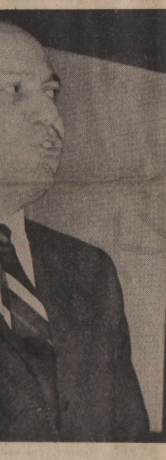
Μακαρέζος — Λαδάς. ‘Εμφανίστηκαν στον στρατηγό Γκιζίκη και έπρότειναν «λύσι Καραμανλή» ύποστηρίζοντες ότι έχουν έπαφή με τó περιβάλλον τού πρώην προεδρουόυ.