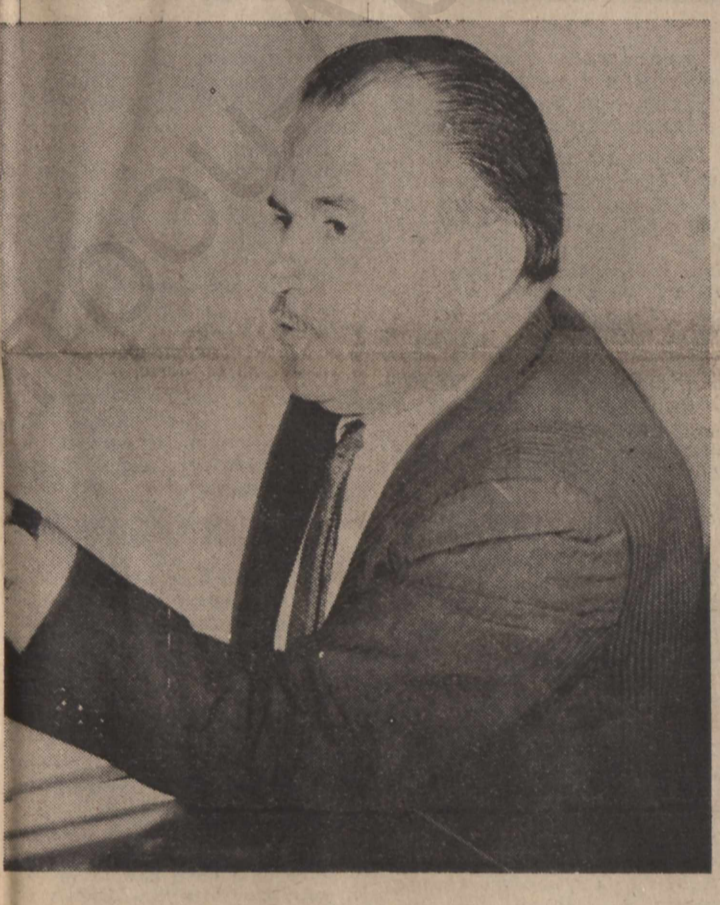
‘Ο πρώην ύπουργός ‘Εξωτερικών κ. Παλαμάς: ‘Γίνουμε άναπόλητοι στο ‘ξοτερικό», έγραψε στον στρατηγό Γκιζίκη