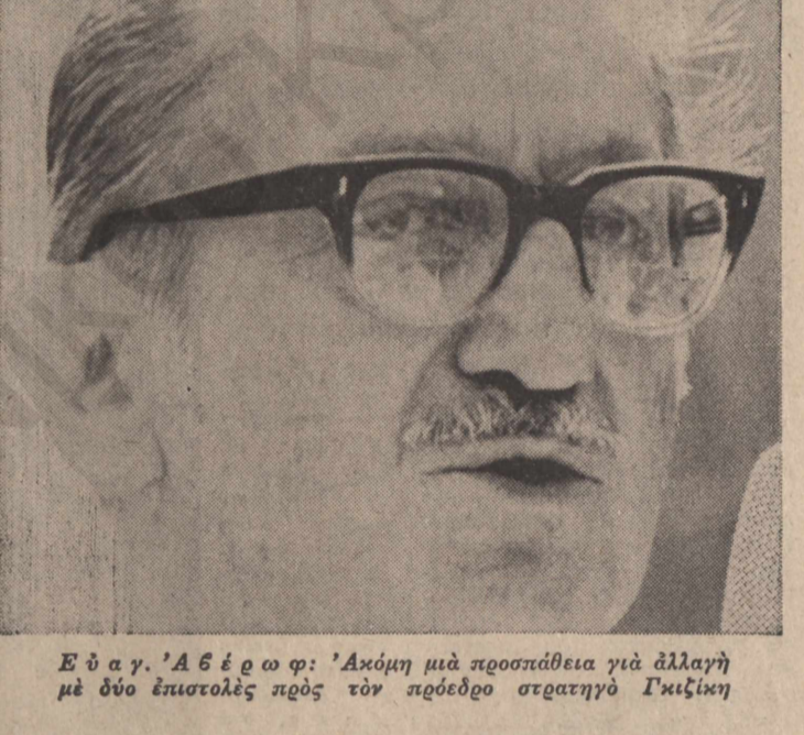
Ε ό α γ. ‘Α β έ ο φ: ‘Ακόμη μιά προσπάθεια για άλλαγή με δύο έπιστολές προς τόν πρόεδρο στρατηγό Γκιζίκη