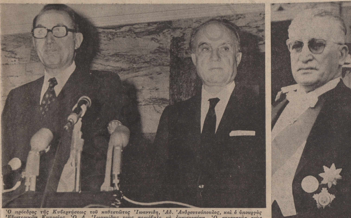
Ο πρόεδρος της Κυβερνήσεως του καθεστώτος Ίωαννίδη, Αδ. Ανδρουτοπούλος, και ο υπουργός Εξωτερικών Καραμανλής, Ο Δ. Ίωαννίδης τους περιβάλει με έμπιστοιση. Ο στρατηγός τους έβλεπε ανατέλλου.

Ο Αδ. Ανδρουτοπούλος δεν κρίνεται κατάλληλος για την πρωθυπουργία. — Δεν έγινε η πρόταση στον καθηγητή Ζολώτα. — Το περιβάλλον του Κωνσταντίνου πλασιάζει τον στρατηγό. — Ο Κωνσταντίνος υπαγορεύει τις προτάσεις του ο Ένα Ξενοδοχείο της Γενεύης. — Μακαρέζος και Λαδάς προτείνουν (Άντι Καραμανλή).