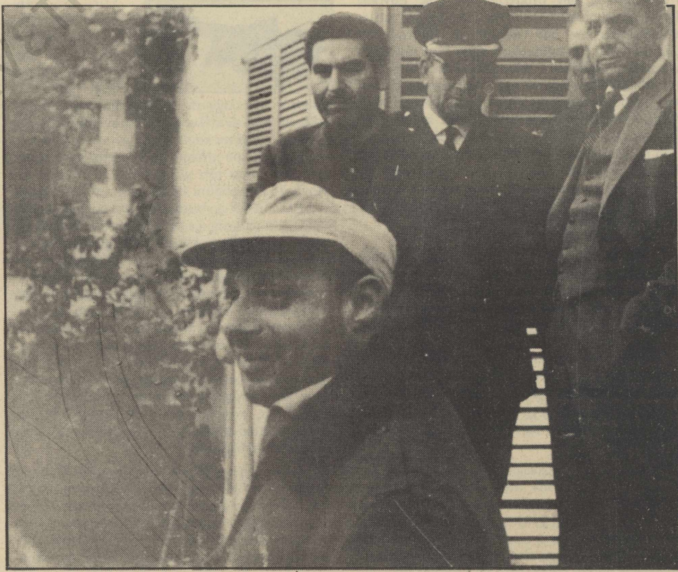
Παρά τις προσπάθειες (όχι πάντοτε προς το συμφέρον της Κύπρου) που έγιναν από διάφορες πλευρές για μια προσέγγιση των δύο μερών (με τις διακοινοτικές συνομιλίες και τον απευθείας ελληνο-

Τα γεγονότα του Δεκεμβρίου του 1963 και η τουρκική ανταρσία, μετέβαλαν ριζικά το χαρακτήρα του κυπριακού κράτους. Με την αποχώρηση των Τουρκοκυπρίων από την κυβέρνηση διασπάται πλέον - έστω και σε περιορισμένη έκταση - η ενότητα του κράτους. Και παρ' όλον ότι τα Ηνωμένα Έθνη, με το ψήφισμα του Συμβουλίου Ασφαλείας της 4ης Μαρτίου 1964, αναγνώριζαν τα εναπομεινάντα ελληνικά μέλη της υπό του Μακάριο κυβέρνησης σαν τη νόμιμη κυβέρνηση της δημοκρατίας, από το 1964 διαμορφώνεται ουσιαστικά στην Κύπρο μια δεύτερη de facto εξουσία, που πήρε αργότερα πιο συγκεκριμένη μορφή με τη δημιουργία, στις 29 Δεκεμβρίου 1967, της «Προσωρινής Τουρκοκυπριακής Διοίκησης», την ανακήρυξη, στις 13 Φεβρουαρίου 1975, του «Ομόσπονδου Τουρκοκυπριακού Κράτους», και, στις 15 Νοεμβρίου 1983, της ανεξάρτητης «Τουρκικής Δημοκρατίας της Βόρειας Κύπρου».