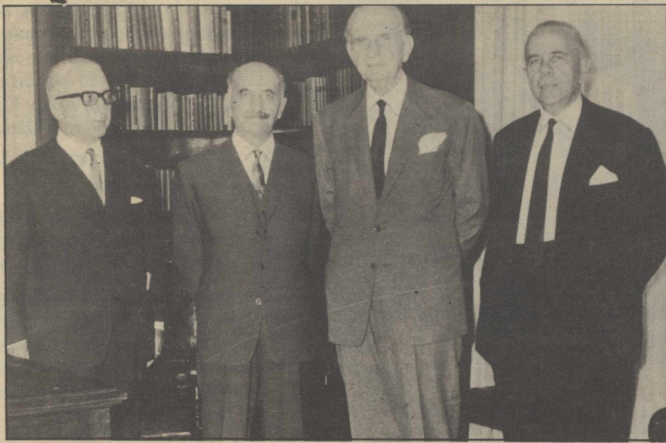
ΓΑΡΟΥΦΑΛΙΑΣ, ΓΡΙΒΑΣ, Ο ΠΡΩΘΥΠΟΥΡΓΟΣ Γ. ΠΑΠΑΝΔΡΕΟΥ ΚΑΙ ΣΤ. ΚΩΣΤΟΠΟΥΛΟΣ (ΥΠΟΥΡΓΟΣ ΕΞΩΤΕΡΙΚΩΝ): Ο ΠΡΩΤΟΣ ΘΕΛΗΣΕ ΤΟΝ ΑΥΓΟΥΣΤΟ ΤΟΥ 64 ΝΑ ΠΡΑΓΜΑΤΟΠΟΙΗΣΕΙ ΤΗΝ «ΑΥΤΟΜΑΤΗ ΕΝΩΣΗ» - ΣΧΕΔΙΟ ΠΟΥ ΑΝΕΣΤΕΙΛΕ Ο ΠΡΩΘΥΠΟΥΡΓΟΣ...