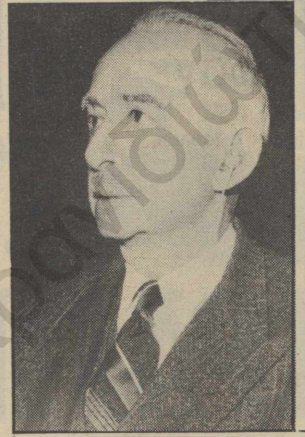
ΙΣΜΕΤ ΙΝΟΝΟΥ: Ο «ΠΡΟΔΡΟΜΟΣ» ΤΟΥ «ΑΤΙΛΑ»