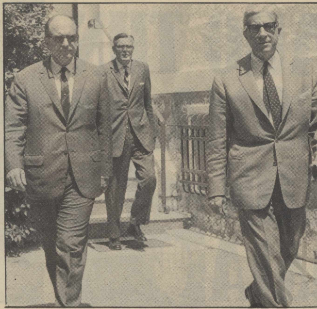
Ο ΑΜΕΡΙΚΑΝΟΣ ΠΡΕΣΒΕΥΤΗΣ Χ. ΛΑΜΠΟΥΙΣ, ΕΚΑΝΕ ΔΙΑΒΗΜΑ ΣΤΟΝ ΕΛΛΗΝΑ ΠΡΩΘΥΠΟΥΡΓΟ Γ. ΠΑΠΑΝΔΡΕΟΥ, ΓΙΑ ΔΗΛΩΣΕΙΣ ΤΟΥ ΑΝΔΡΕΑ ΠΑΠΑΝΔΡΕΟΥ (ΕΔΩ ΜΑΖΙ ΣΤΟ ΚΑΣΤΡΙ) ΥΠΕΡ ΤΗΣ ΚΥΠΡΟΥ!