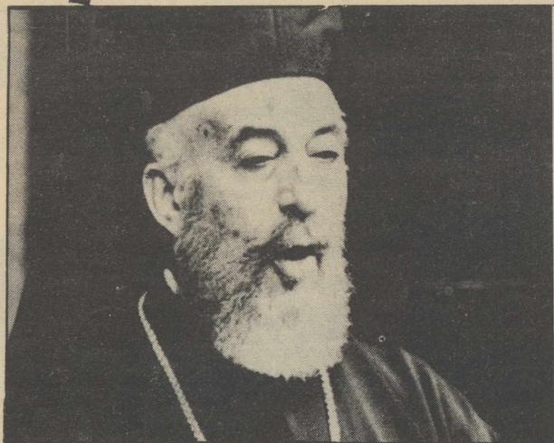
Ο Μακάριος χαρακτήριζε το 1973 την πρόταση του Τούρκου πρωθυπουργού Ετζεβίτ για ομοσπονδποίηση της Κύπρου, σαν υπονόμηση των συνομιλιών και αντίθετη προς τα ψηφίσματα και το πνεύμα των Ηνωμένων Εθνών...