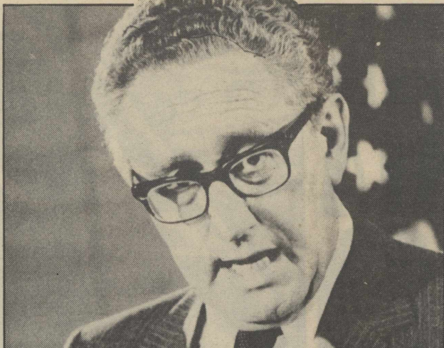
Χένρι Κίσινγκερ: Ο ρόλος του Αμερικανού υπουργού Εξωτερικών εκείνα τα χρόνια, στα διεθνή πράγματα, ήταν κυρίαρχος. Η αυταρχική του προσωπικότητα δέσποζε στο διεθνές πεδίο