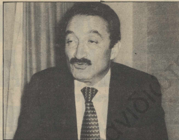
Μπουλέντ Ετζεβίτ: Στις εκλογές του 1971 εκλέγεται πρωθυπουργός της Τουρκίας. Διακηρύσσει το σχέδιό του για δημιουργία ομοσπονδίας στην Κύπρο και είναι αυτός που αποφασίζει και πραγματοποιεί την απόφαση στη Μεγαλόνησο