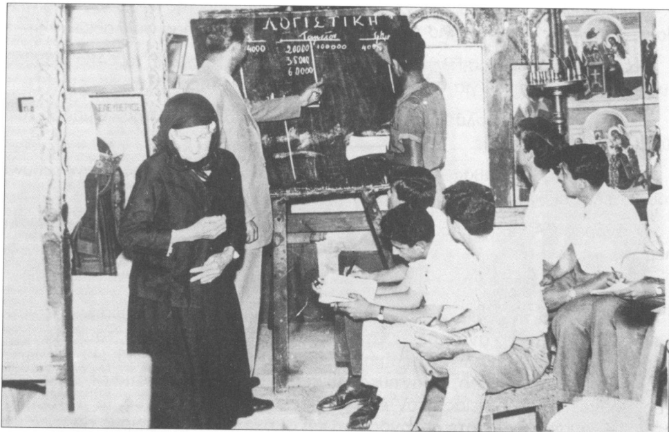
Μαθητές παρακολουθούν μαθήματα στην εκκλησία μετά το κλείσιμο του σχολείου τους

Κατόπιν οδηγιών και πάλιν του Διγενή, ο υπεύθυνος της νεολαίας Λεμεσού προχώρησε στη συγκρότηση μιας ειδικής ομάδας, της «Ομάδας των Δέκα», η οποία είχε το χαρακτήρα εφεδρικής ομάδας κρούσεως, με αποστολή την ανάλη-