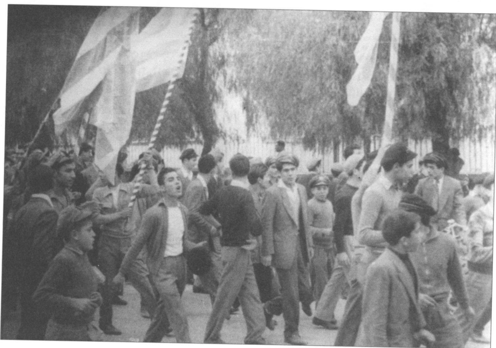
Η γαλανόλευκη στη μαθητική διαδήλωση

Στη Λευκωσία, μέχρι το Μάρτη του 1955 είχαν οργανωθεί περί τις 8 ομάδες μαθητών. Η κυκλοφορία της πρώτης προκήρυξης του Διγενή, τη νύκτα της 31ης Μαρτίου προς την 1η Απριλίου 1955, υπήρξε η πρώτη αγωνιστική εκδήλωση της