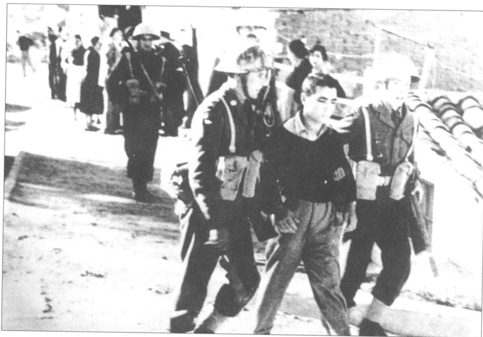
Σύλληψη μαθητή κατά τη διάρκεια διαδήλωσης

Οι κατά τόπους ηγέτες της ANE ήταν καθηγητές ή εργαζόμενοι νέοι ή νέοι επιστήμονες ή ακόμη και μαθητές. Πολύ συχνά η ηγεσία της νεολαίας υφίστατο αλλαγές είτε γιατί κάποιος από τους ηγέτες της αναλάμβαναν άλλα καθήκοντα είτε γιατί αυτοί συλλαμβάνονταν και εγκλείονταν στα κρατητήρια και τις φυλακές.