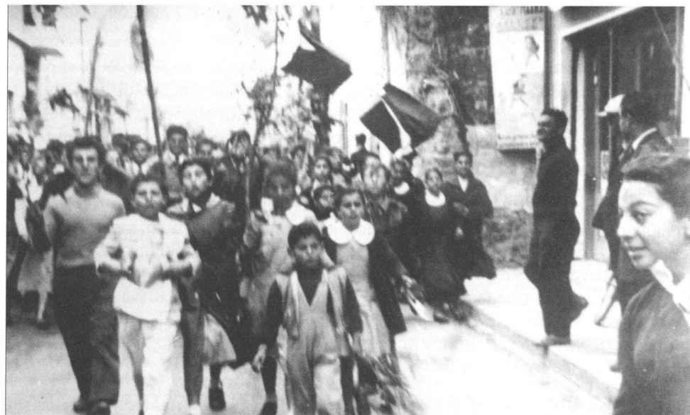
Παιδάκια του δημοτικού σχολείου σε διαδήλωση

Η τριήμερη Παγκύπρια Εορτή Νεολαίας πραγματοποιήθηκε και το 1959 (29-31 Μαΐου) κι αυτή τη φορά ήταν αφιερωμένη στον Αρχηγό Διγενή. Ήταν απίστευτα πλούσια σε περιεχόμενο και μετείχαν σ' αυτή και Δημοτικά και Γυμνάσια απ' όλη την Κύπρο. Περιλάμβανε εκθέσεις τέχνης, χειροτεχνίας, βιβλίου, ελληνικούς χορούς, γυμναστικές επιδείξεις, αθλοπαιδιές, αγωνίσματα στίβου, ομιλίες, απαγγελίες, χορωδίες, ορχήστρες, σκετσάκια, θεατρικά έργα και αρχαίες τραγωδίες. Αναφέρονται ενδεικτικά κάποια από τα θεατρικά έργα και τις τραγωδίες που παρουσιάστηκαν: «Η θυσία του Αβραάμ», «Ο Κατσαντώνης» του Θεοτοκά, «Το Μπλοκ C» του Βενέζη, «Να ζη το Μεσολόγγι» του Ρώτα, «Οι Όμηροι» του Ακρίτα, «Η Αντιγόνη» του Σοφοκλή, «Η Ιφιγένεια εν Ταύροις» και «Οι Φοίνισσες» του Ευριπίδη.